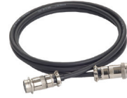
ASG-CB2500 Jatkokaapeli (EX)