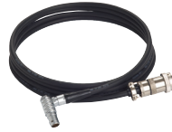
ASG-CB2500 Kulmakaapeli (RA)