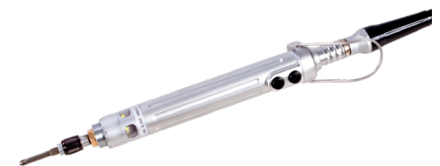
FX-malli tukivarteen kiinnitettäväksi